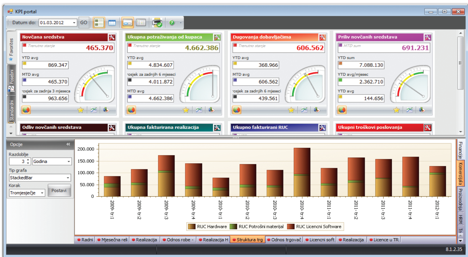
KPI Manager Portal: komanda ploča s koje je omogućen pristup i uvid u ključne pokazatelje poslovanja, pozadinskim podacima, year-by-year analizama, trendovima, usporednim grafičkim analizama...